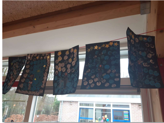
Fijne vakantie, team Kiddo's