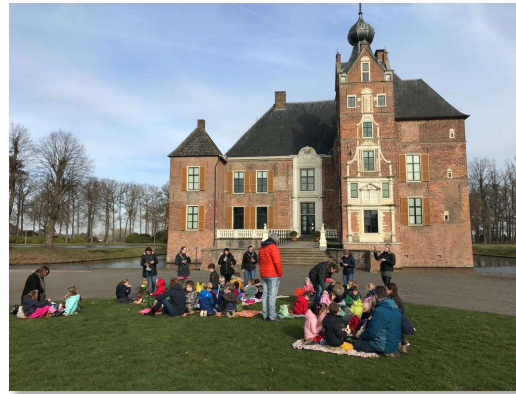
Alle Toverhoedjes gingen naar huis met een kastelen paspoort van het Gelders Landschap & Kastelen, het is een stempelkaart van in totaal 7 kastelen.

Na de vakantie beginnen we met het thema Muziek! Op maandag 4 maart is er geen keuzewerk. We starten weer op 11 maart met keuzewerk, we hopen dat er weer veel ouders zijn die ons komen helpen. Keuzewerk is elke maandag van 13.15 tot 14.00 uur.