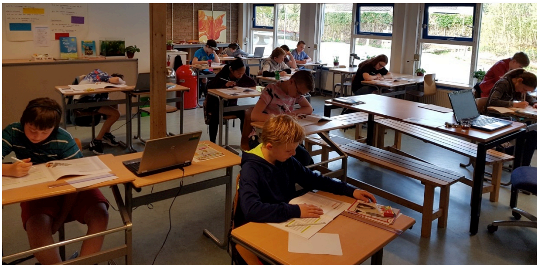
Kinderen groep 8

"Leuk zo met groep 8 samen, het lijkt al een beetje op het voortgezet onderwijs!"