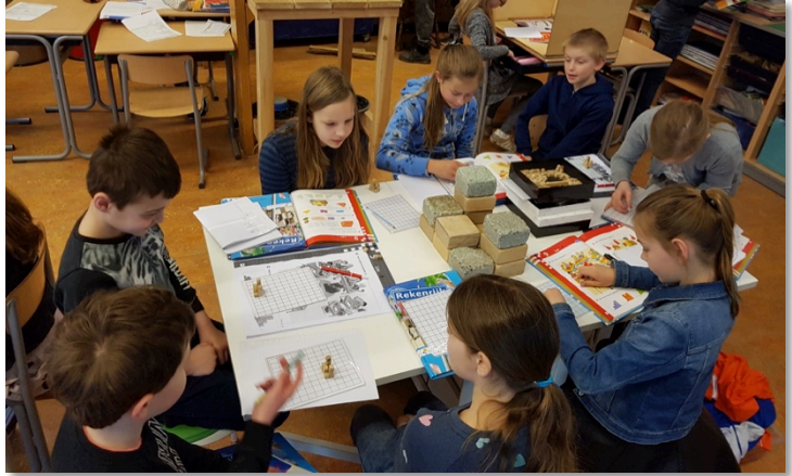
Kinderen aan het rekenen met bouwplaten en plattegronden.

Groep 8 heeft het lezen van een kaart weer herhaald. Hoe lees je een legenda? En maak je gebruik van de schaal van een kaart?