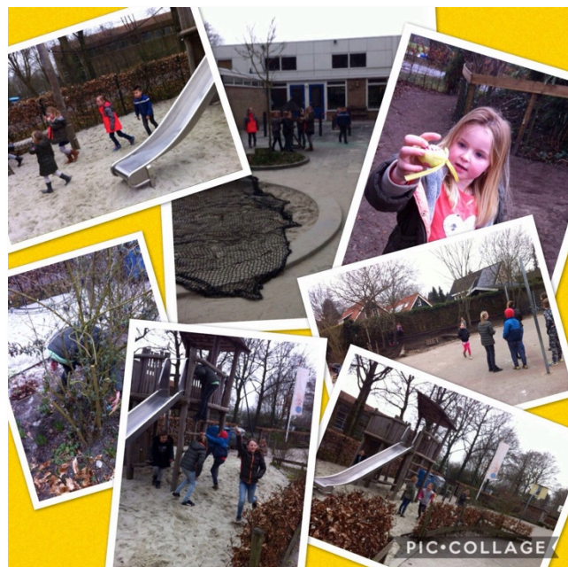
Fijne paasdagen allemaal! Team Kiddo's